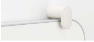
写真組フタ用風呂フタフック:PBF-FK-1/W91 ¥3,100 保温風呂フタフック:PBF-FK-4/W91 ¥4,000